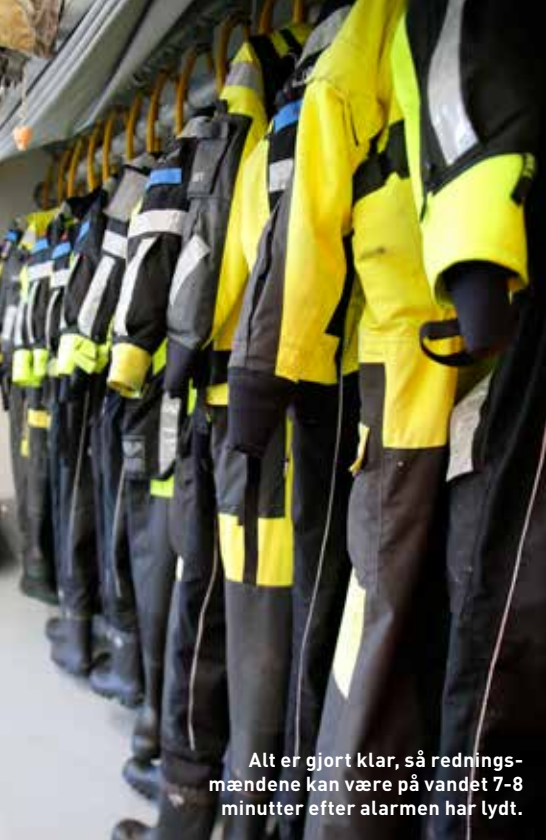
Alt er gjort klar, så redningsmændene kan være på vandet 7-8 minutter efter alarmen har lydt.