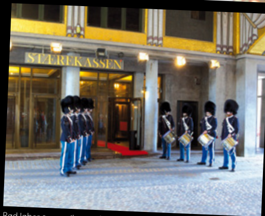
Rød løber og musikanter fra Livgarden bød de 40 topchefer velkommen til Temadag i Stærekassen.