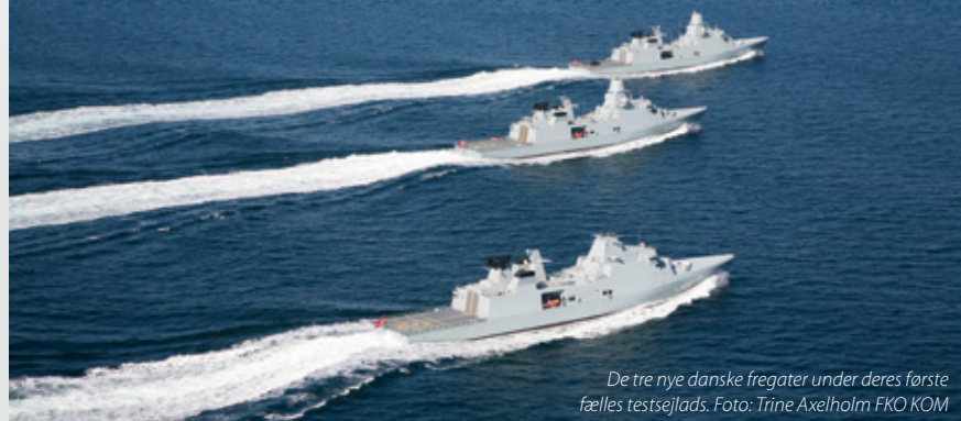
De tre nye danske fregatter under deres første fælles testsejlad.

Det er Odense Staalskibsværft, der har bygget de tre fregatter, som hver er 138 meter lange og har en besætning på 101 mand. Fregatternes opbygning og design er fremtidssikret, og våben- og sensorpakken kan løbende opdateres og udbygges i takt med ændrede politiske prioriteringer og vekslende opgaver.