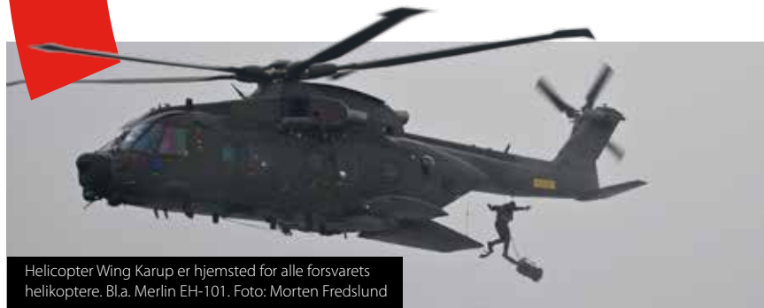
Helicopter Wing Karup er hjemsted for alle forsvarets helikoptere. Bl.a. Merlin EH-101.

Aftalen understreger en tættere tilknytning af flyverhjemmeværnets bevogtningsassistenter til wingens bevogtningstjeneste. Samtidig danner aftalen grundlag for flyver-