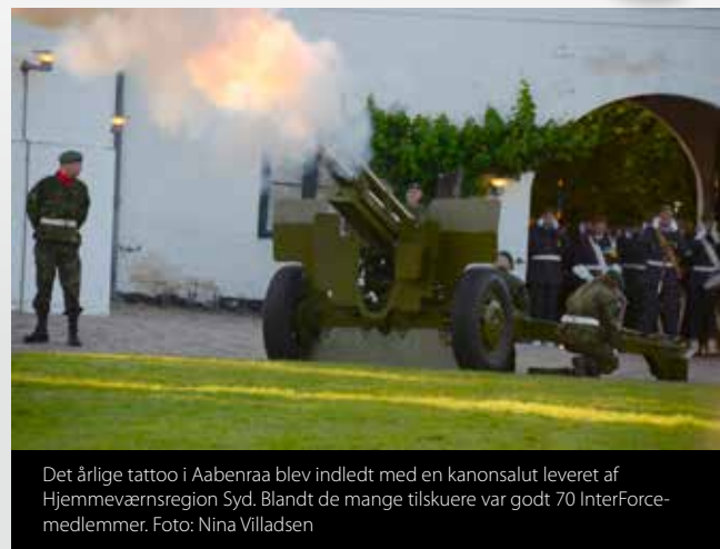
Det årlige tattoo i Aabenraa blev indledt med en kanonsalut leveret af Hjemmeværnsregion Syd. Blandt de mange tilskuere var godt 70 InterForce-medlemmer.

Brundlund Slot blev grundlagt af Dronning Margrethe den Første i 1411. I befæstningen af slottet indgik et vandmølleanlæg, som i dag er Danmarks ældste befæstede vandmølle, og her mødtes deltagerne til lidt mad og et glas før tattooet. ■