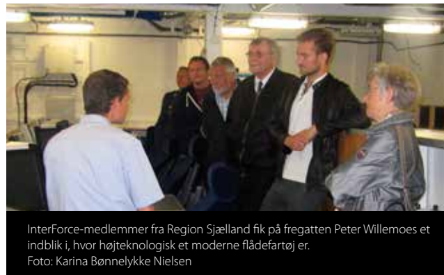
InterForce-medlemmer fra Region Sjælland fik på fregatten Peter Willemoes et indblik i, hvor højteknologisk et moderne flådefartøj er.