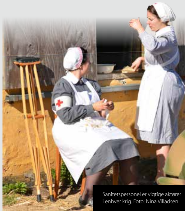
Sanitetspersonel er vigtige aktører i enhver krig.

Publikum oplevede også en 15 minutter lang stillingskamp mellem allierede og tyske tropper i skyttegravene i det nordlige Frankrig i 1944 – som de allierede selvfølgelig vandt. ■