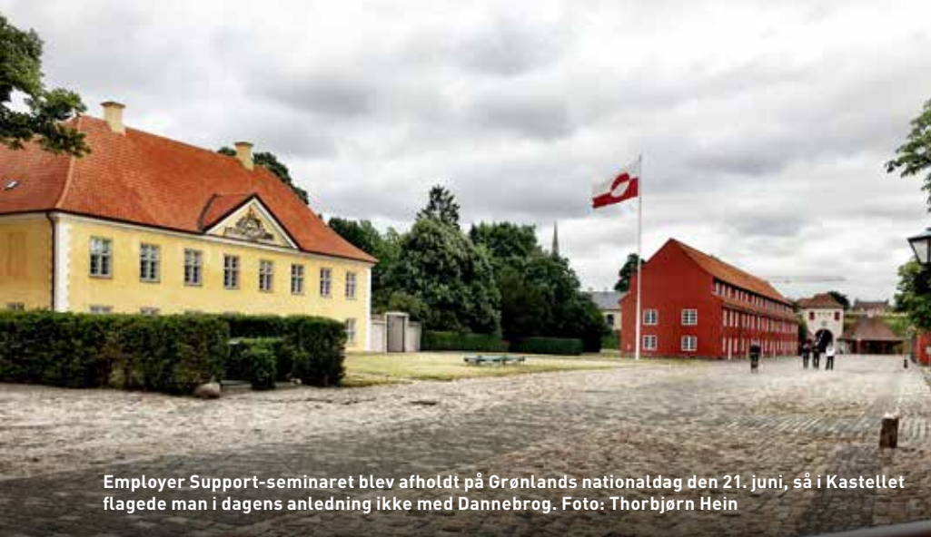
Employer Support-seminaret blev afholdt på Grønlands nationaldag den 21. juni, så i Kastelet flagede man i dagens anledning ikke med Dannebrog.