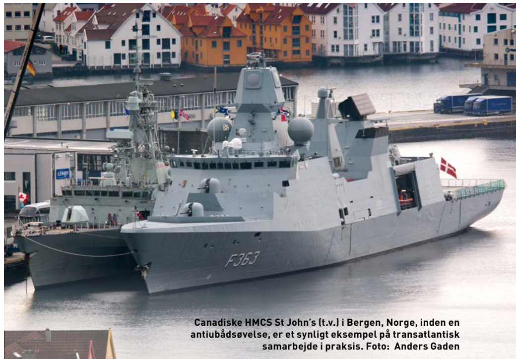
Canadiane HMCS St John's (t.v.) i Bergen, Norge, inden en antiubådsøvelse, er et synligt eksempel på transatlantisk samarbejde i praksis.