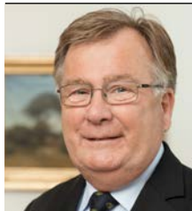
Af forsvarsminister Claus Hjort Frederiksen