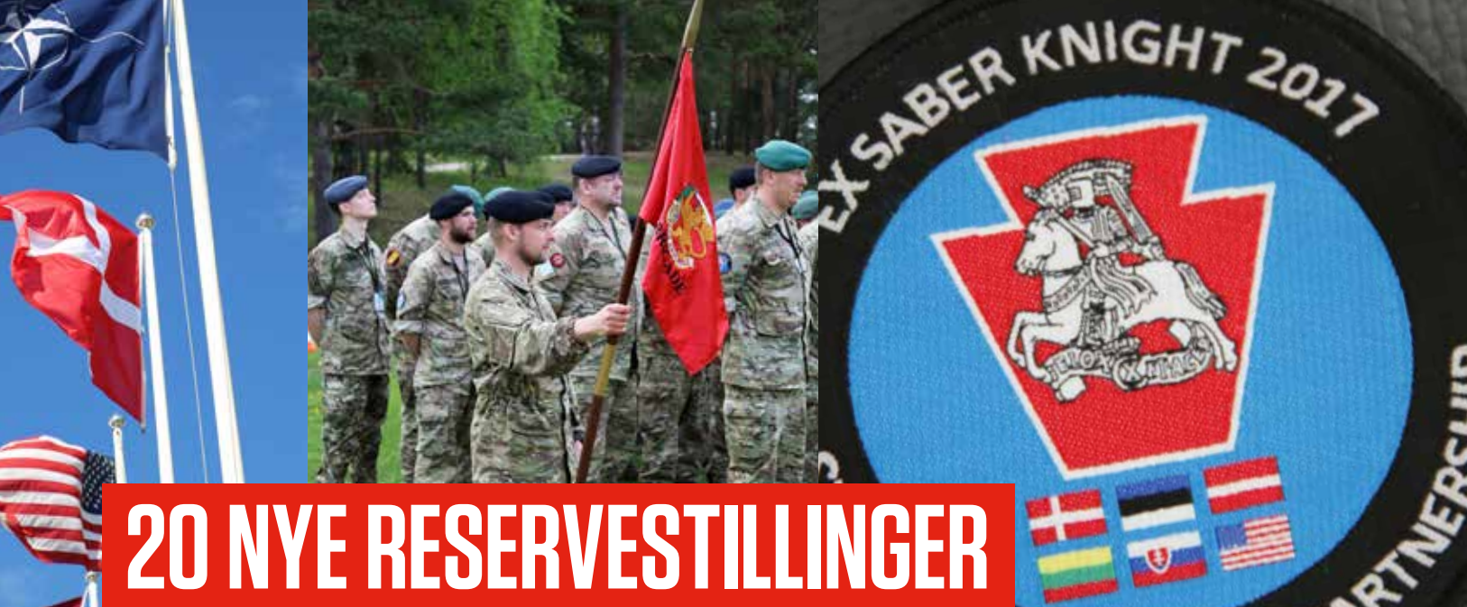
Seks nationer deltog i Saber Knight.