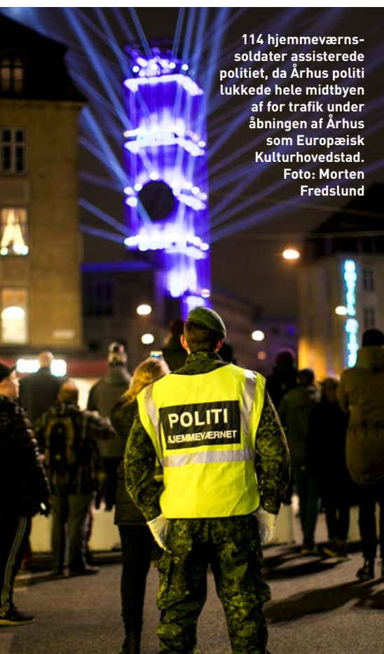
114 hjemmевærns-soldater assisterede politiet, da Århus politi lukkede hele midtbyen af for trafik under åbningen af Århus som Europæisk Kulturhovedstad.

Bornholm, Beredskabsstyrelsen, Politiet, Bornholms Regionskommune, InterForce-medlemmer og andre aktører. Garnisonsgudstjenesten er en tradition tilbage fra det tidligere Bornholms Værns start i 1947. Totalforsvarsgudstjenesten er en tradition siden 2006. ■