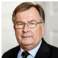
Af Claus Hjort Frederiksen, Forsvarsminister (V)