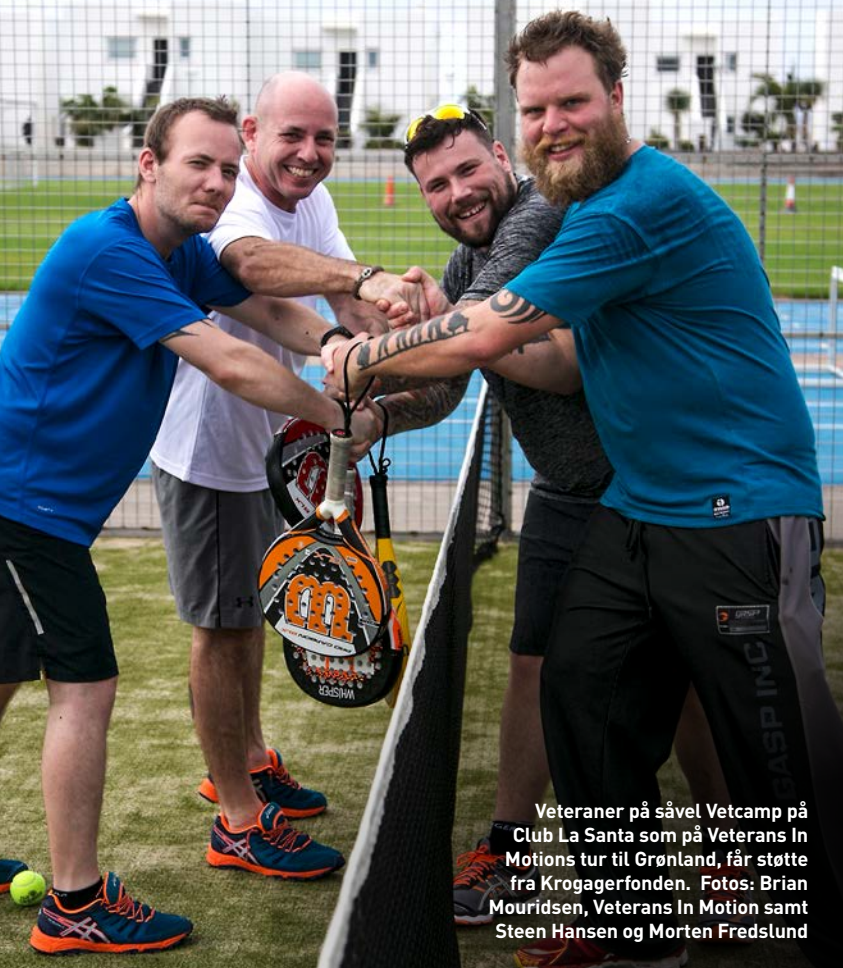
Veteraner på såvel Vetcamp på Club La Santa som på Veterans In Motions tur til Grønland, får støtte fra Krogagerfonden.