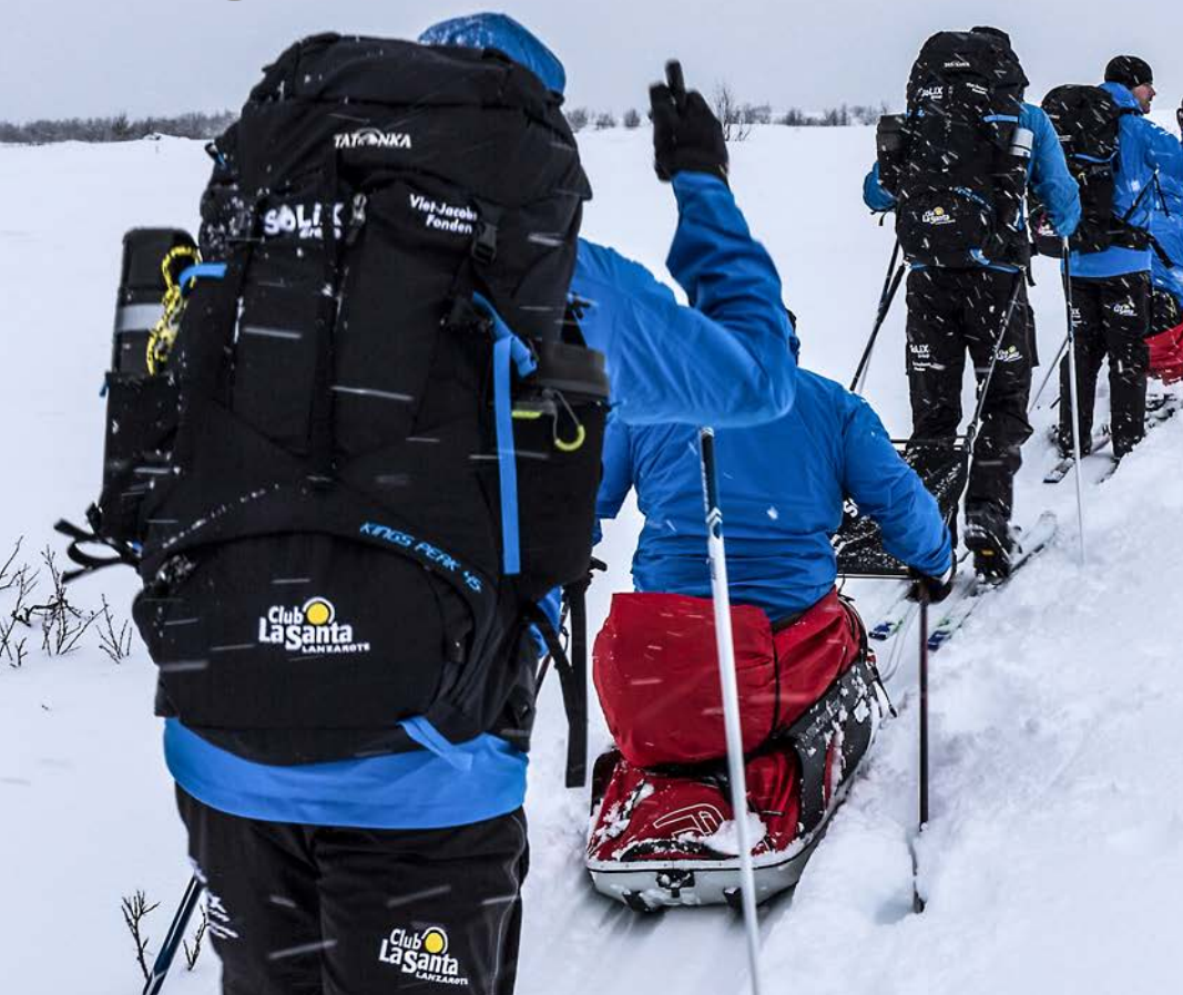
Club La Santas karakteristiske logo præger tøj og udstyr på de veteraner, der i Grønland skal tilbagelægge 384 km på ski. Her et glimt fra en træningstur i Norge.