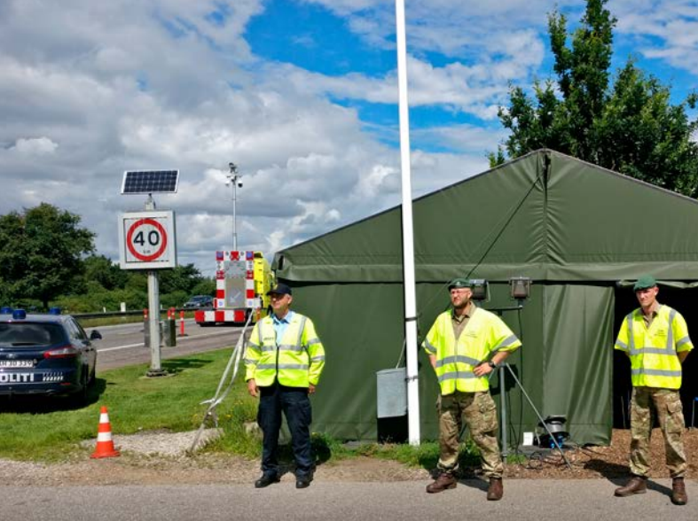
Der indgår 90 hjemmeværnssoldater i det kompagni, der bistår politiet ved de tre grænseovergange ved den dansk-tyske landegrænse.