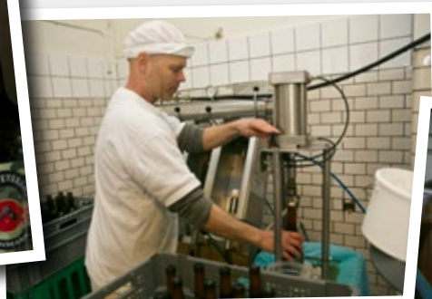
Alle otte bryg på Gundestrup Mejeri og Bryghus bliver påkapslet i hånden.