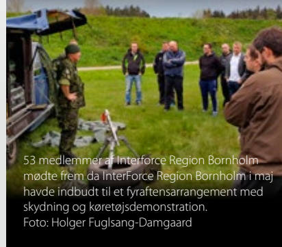
53 medlemmer af InterForce Region Bornholm mødte frem da InterForce Region Bornholm i maj havde indbudt til et fyraftensarrangement med skydning og køretøjsdemonstration.

En kraftig regnbyge undervejs i arrangementet rokkede ikke ved humøret og ved 20-tiden blev det rundet af med præmieuddeling til de tre bedste skytter.