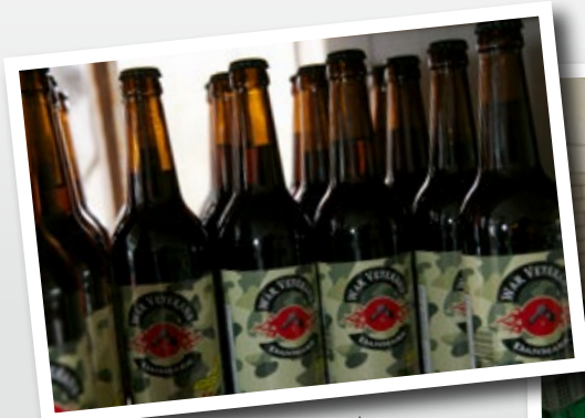
Der sælges ca. 800 liter – 1200-1600 stk. – Veteran Pilsner om måneden

https://www.facebook.com/pages/Veteran-Pilsner/904142512981857